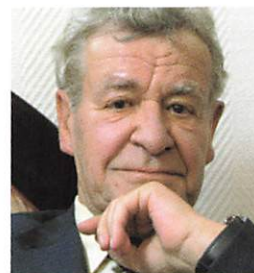
Stargast: Oswald Kolle

Aktuell geht es am 15. 9. 2008 in Mainz (Bürgerhaus Lerchenberg) um Durchblutungsstörungen. Dieses Thema ist sehr vielfältig. Darauf wird Sie auch unser Ehrengast Oswald Kolle hinweisen. Sie erinnern sich? Oswald Kolle schrieb in den 60er und 70er Jahren mit eloquenter Feder und direkten Worten die ersten Aufklärungsbücher der Nation. Auch heute hat er zu „seinem Thema“ so einiges Neues zu erzählen.